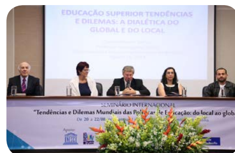
21/08: Mesa de abertura dos trabalhos no Campus II.